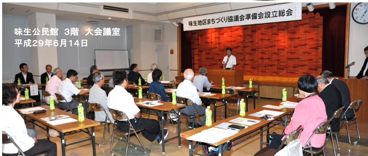
味生公民館 3階 大会議室 平成29年6月14日