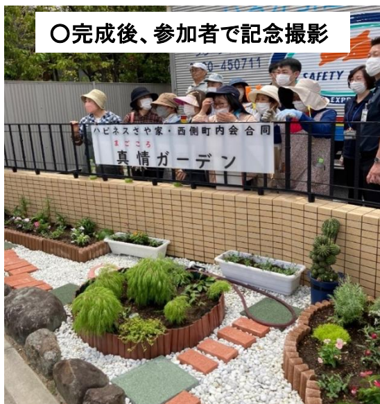
○完成後、参加者で記念撮影

西側町内会は、町内の夏祭りや餅つき体験会に入所者の方たちを招待しています。また、音響設備の充実した大ホールをお借りしての町内の敬老会は、食事会がカラオケ大会に発展して、楽しい時間を過ごさせて頂いています。(コロナ禍により2年連続開催を中止しています)