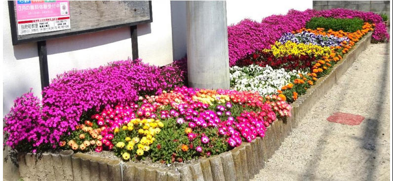
別府集会所の芝桜