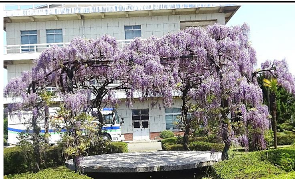
コスモ松山石油の藤棚