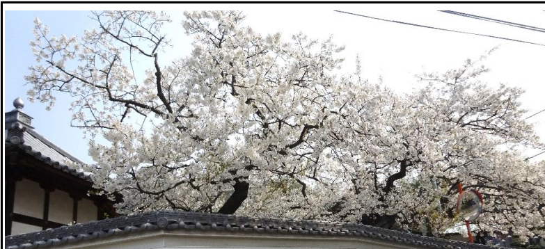
大徳寺の桜（味生で一番早く咲く）