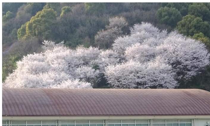
津田山の桜（津田中より）