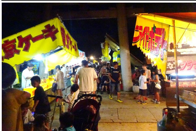
日吉神社境内での露店の様子