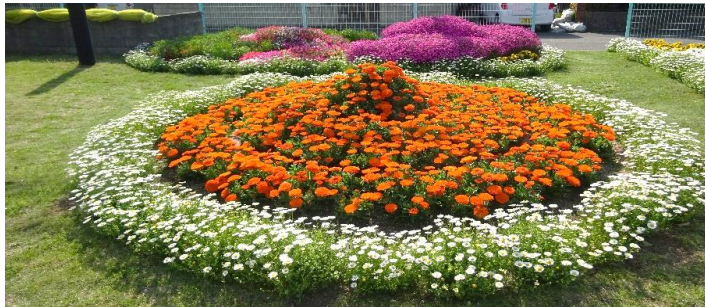
清水西団地公園（花壇コンクール・3年連続市長賞）