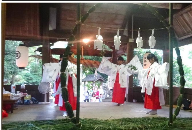
女子中学生が、豊作を祈って 豊栄舞を奉納