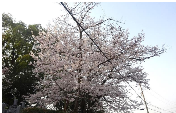
浄明院の桜（味生で一番遅くまで咲いている）