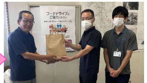
松山市地域包括支援センター 生石・味生へ