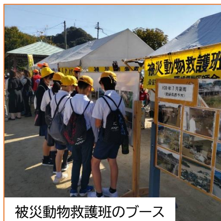
被災動物救護班のブース