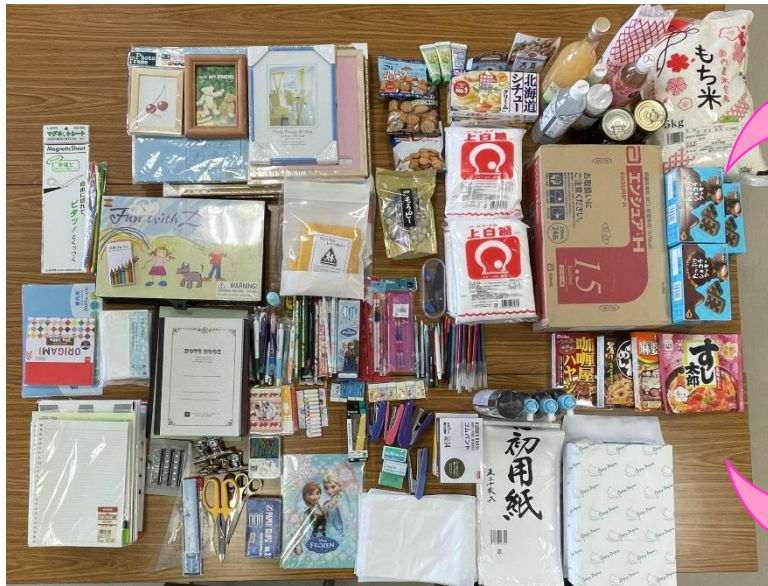
届けていただいた食品や文具

9月11日に松山市地域包括支援センター生石・味生と地域のまごころ食堂にお渡ししました。必要とする施設やご家庭、個人に届けていただいたり、食材として活用していただくことになりました。