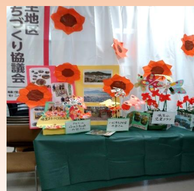
11月3日 味生まち協事務所