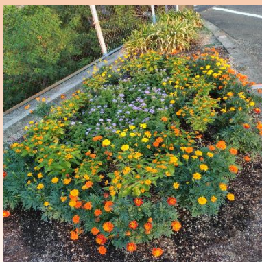
9月ごろ 真情橋花壇に咲いたマリーゴールドなど

環境部が育てているまごころ橋のオレンジ色のマリーゴールド、プロジェクトに賛同する小学生から高齢者までが作成したオレンジの花でいっぱいの作品は「暮らしやすいまちづくり」への発信です。作品は松山市総合福祉センターとまちづくり協議会の事務所に展示しました。