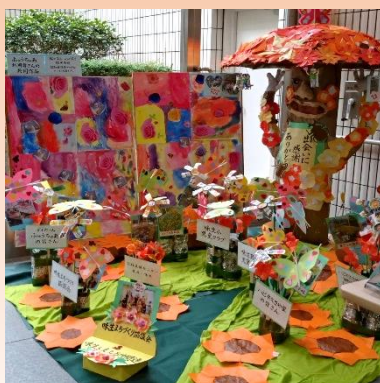
9月展示 松山市総合福祉センターロビー