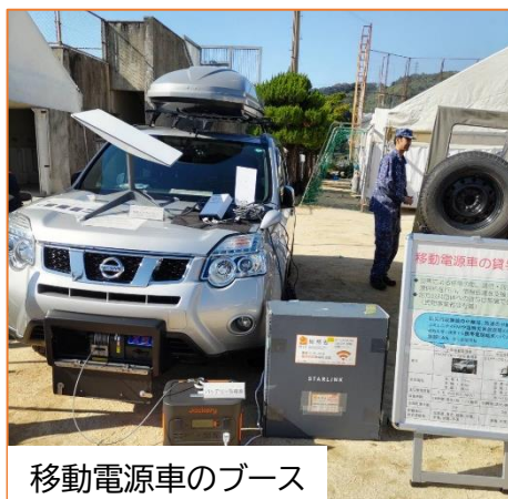
移動電源車のブース